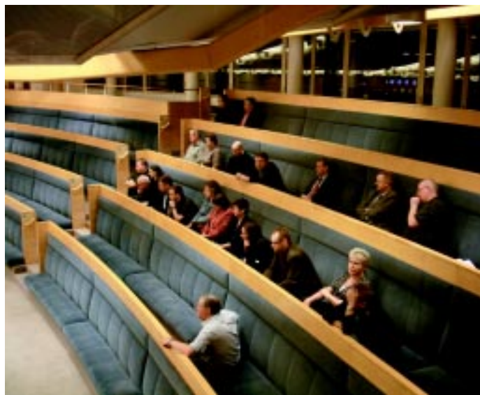
Tullrådsledamöterna på riksdagens åhörarläktare under den långa interpellationsdebatten i riksdagen